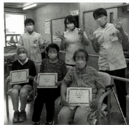
目標を達成しました！（7月期生）

一歩踏み出す勇気 この教室は、3か月後にできるようになりたいことを具体的な目標にすることから始まります。時には体調の変化で目標を達成できない場合もありますが、その場合は目標を見直すことや、別のサービスに変更することも可能です。大切なことは、歳だから…と諦めない気持ちと、一歩を踏み出す勇気です。