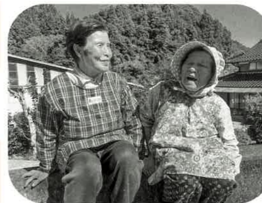
のりちゃん(84歳) しげちゃん(91歳)