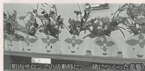
(町内サロンでの活動時に、一緒につくった花瓶)