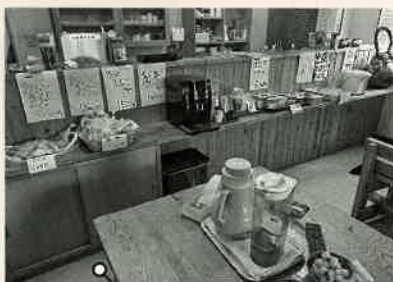
注目!! の憩いスペース