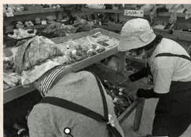
従業員さんたちの後ろ姿